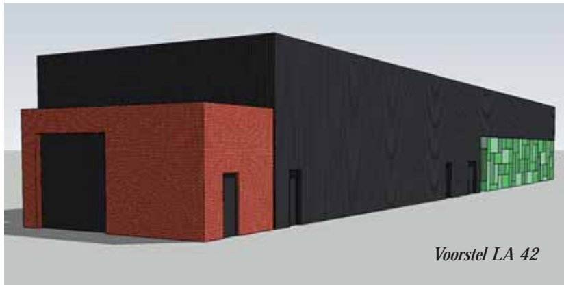
Voorstel LA 42

De bestemming van de site 'Afrif LA42' is nagenoeg onbekend onder de bevolking. Vandaar dat we op deze manier graag enige duiding geven over wat er in dit gebouw in de toekomst te gebeuren staat. En dat wordt heel wat. 'Afrif LA42' zal immers tegelijk diverse gemeentelijke diensten huisvesten, recreatiemogelijkheden creëren voor verenigingen en zinvolle gemeentelijke initiatieven mogelijk maken.