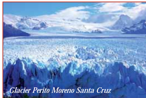
Glacier Perito Moreno Santa Cruz

Boedapest zit Praag op de hielen als interessante Centraal Europese stad.