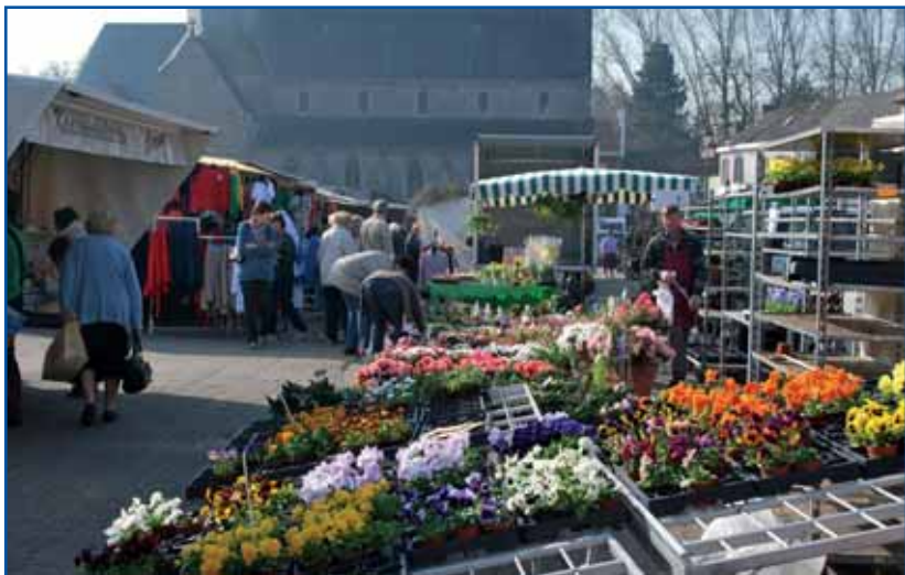
De wekelijkse markt op woensdag in Scheldewindeke blijft plaatsvinden op woensdagen 26 december 2012 en 2 januari 2013.