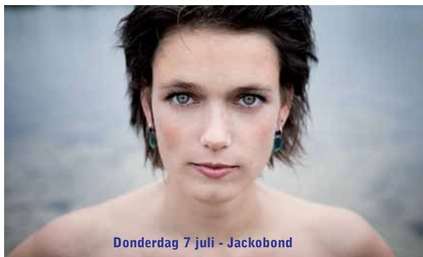
Donderdag 7 juli - Jakobond