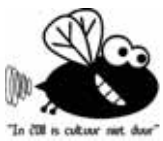
FOTO- en KLEURWEDSTRIJD