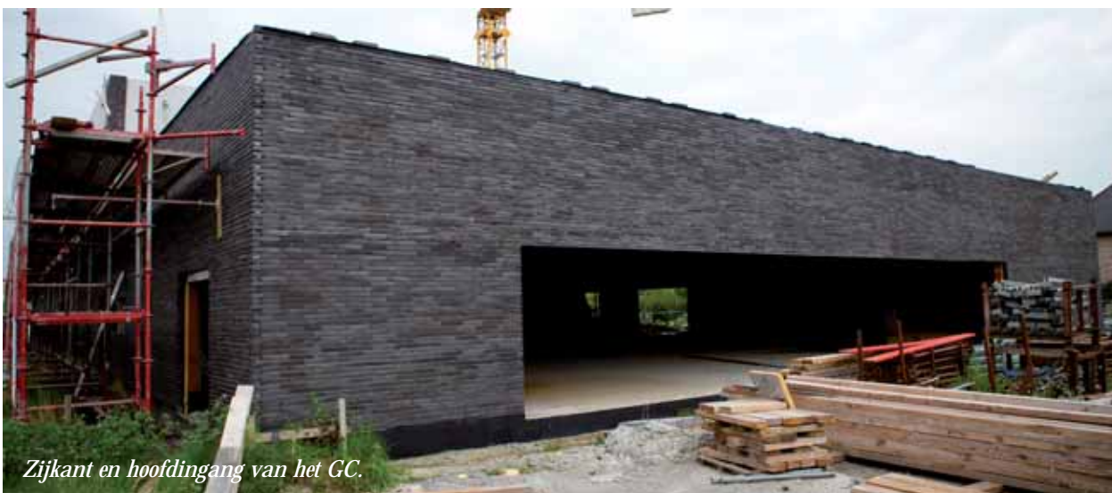
Zijkant en hoofdingang van het GC.