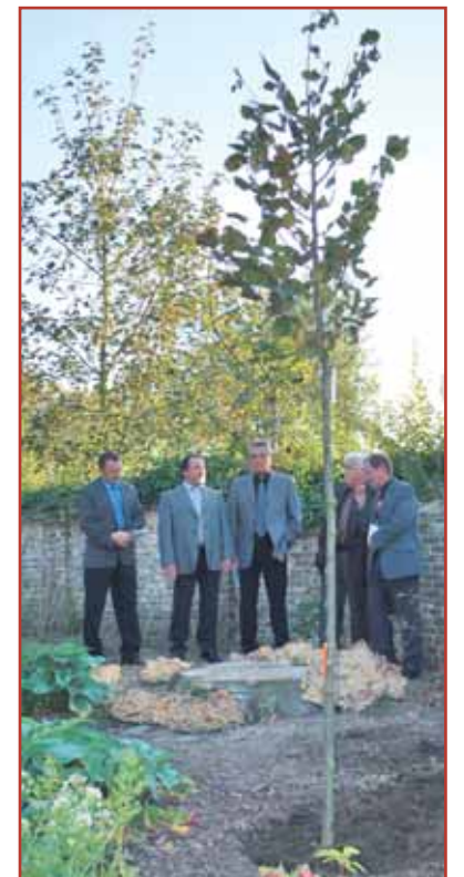
Enkele leden van het Hecker-Chörle brengen een nummer ter gelegenheid van deze boomplanting en jumelage.

Meer foto's van dit feestweekend vind je op www.oosterzele.be > vrije tijd > fotoboek.