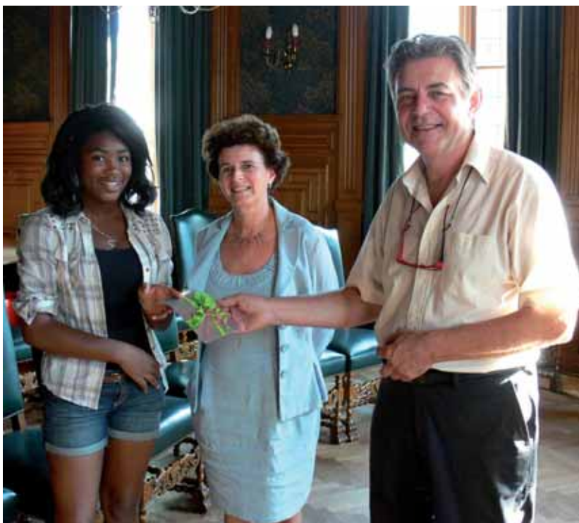
Op dinsdag 27 september 2011 werd de 1 000-ste leerling ingeschreven.

Meer info en kaarten op het secretariaat van de academie.