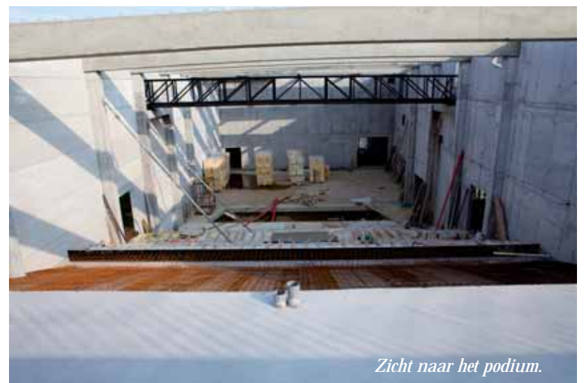
Zicht naar het podium.