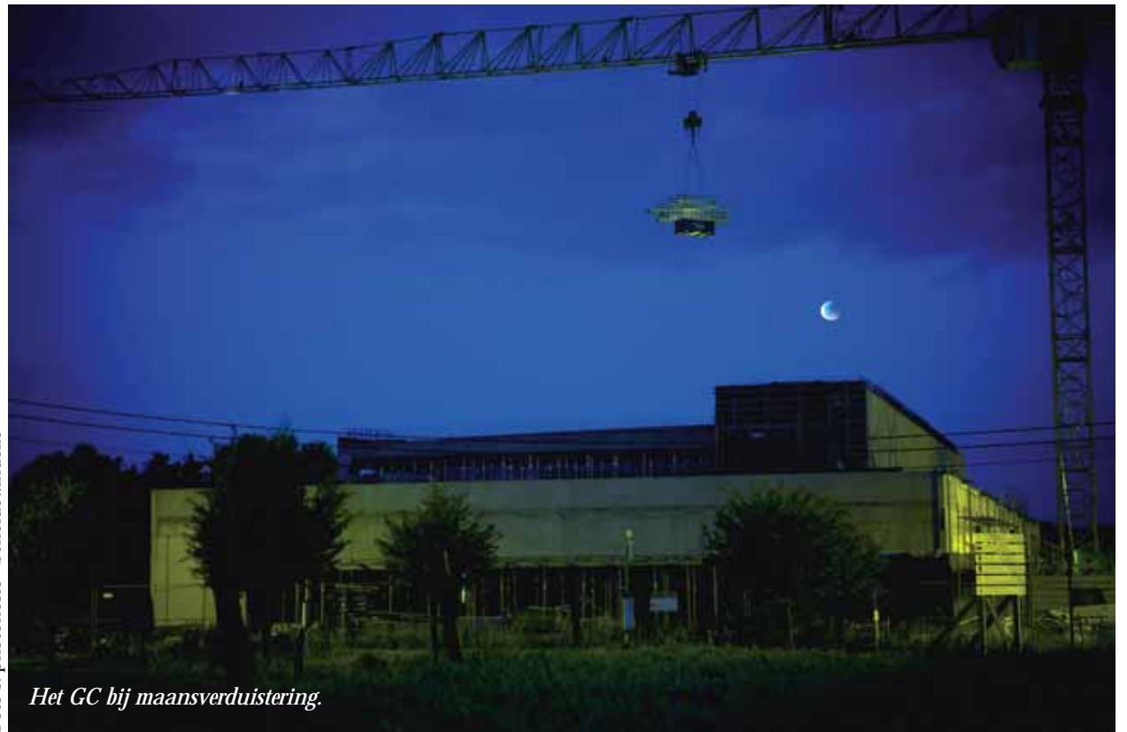
Het GC bij maansverduistering.