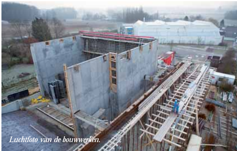
Luchtfoto van de bouwwerken.

Na de start van de werken aan het nieuwe Gemeenschapscentrum (GC) De Kluize in Scheldewindeke in september 2010, heeft het gebouw al een hele evolutie ondergaan. De ruwbouw is ondertussen afgewerkt en men is nu bezig met het wind- en waterdicht maken van het gebouw. Op hetzelfde moment is de firma ook gestart met het vloeren, bepleisteren, leggen van elektriciteit en plaatsen van het sanitair. Daarna volgen het schrijnwerk, los meubilair, theatertechnieken en licht. In mei/juni 2012 zal het GC voor het publiek geopend worden. Via deze foto's laten we je graag al even meekijken.